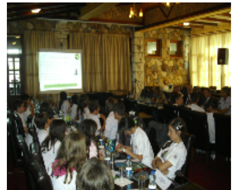
Nxënësit e shkollës fillore në klubin për energji & mjedis