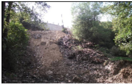
Bregu pas pastrimit

http://www.fao.org/mnts/intl_mountain_day_en.asp